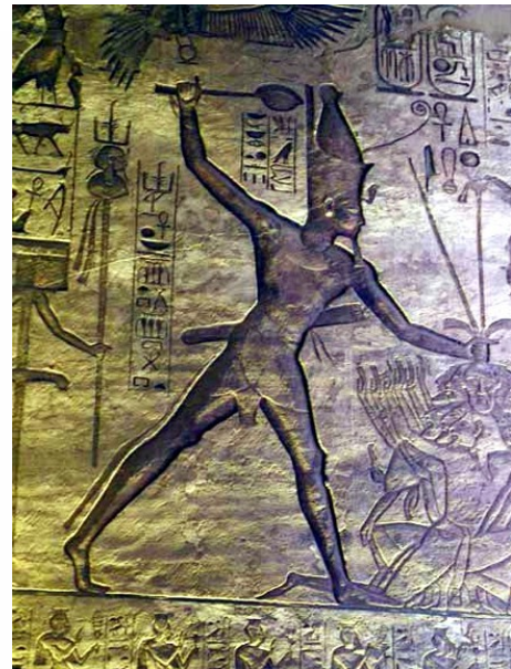
Relieve faraón matando a su enemigo