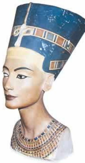
Busto de Nefertiti