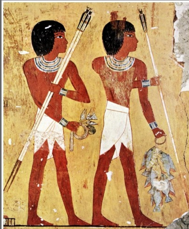
TUMBA DE KANAMON. TEBAS